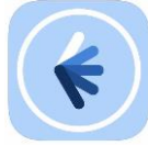
Film+Schule NRW TOPSHOT iOS | android kostenlos

Ausprobier-Applikation zur Kamera- und weiterführenden Filmarbeit