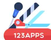
123APPS.com iOS | android kostenlos

browserbasierte Video- und Audio-Rekorder, -Converter & -Schnittsoftware