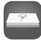
Cardflow iOS | android kostenlos

Karten-Applikation, z.B. mit Storyboard- Template