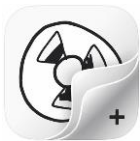
FlipaClip iOS kostenlos

Karten-Applikation, z.B. mit Storyboard- Template