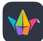
PADLET iOS | android kostenlos